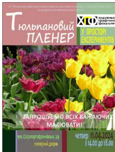
А. Носенко. Афіші ірисового та тюльпанового пленерів на ХГФ. 2024

бувають восени «гарбузовий пленер», взимку – «різдвяні мотиви», весною – «тюльпановий», «бузковий», «ірисовий» пленери, влітку – пленерна практика та «домашнє» завдання на літо. Тема природи – вічна і невичерпна, проте майбутні розвідки передбачено у синтезі, стику різних дисциплін. Останнім часом на факультеті додано «вибіркові дисципліни» і, як показала практика, отримано відмінні результати. Наприклад, у вибіркових дисциплінах «Міський пейзаж», «Декоративний пейзаж» зроблено твори, що були й будуть ще показані на виставках, а студенти отримали гарний досвід, що їм знадобиться у викладацькій і самостійній творчій діяльності в майбутньому.