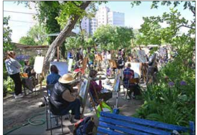
Студенти творять під час «ірисового пленеру» на ХГФ. 2024