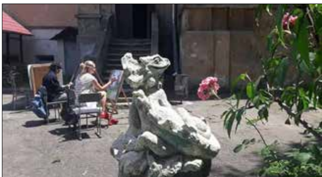
Пленер у дворіку ХГФ