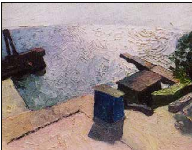
Ю.М. Єгоров. Плаж Отрада, Одеса. 1988

«Салони Іздебського», новаторство «Незалежних» тощо. Південноукраїнські традиції живопису мають продовження в творчості одеських митців минулого і сьогодення. Серед найбільш яскравих представників можна відзначити твори В. Синицького, М. Шелюто, А. Гавдзинського, В. Литвиненка. Твори Ю. Єгорова міццю світлової матерії вплинули на наступні покоління митців. Мистецьку ситуацію 1960–80-х рр. однозначно трактувати неможливо. Кращими представниками «соцреалізму» були теж талановиті майстри (П. Пархет, К. Філатов). Виникали варіанти непрямого дистанціювання, наприклад «суворий стиль», що поєднав сезаннізм з монументальністю і героїзацією образів 1960-х рр. (О. Ацманчук, Ю. Єгоров, В. Токарєв), тяжіння до імпресіонізму (В. Синицький, Г. Малишев, Д. Фруміна), «фольклоризм» (А. Антонюк, В. Алтанець, Ю. Коваленко). Були талановиті митці, які, крім замовних робіт, створювали професійний гарний живопис у жанрах портрету, пейзажу, натюрморту, композиції (М. Божий, К. Ломикін, В. Токарєв, А. Лоза, О. Слешинський, В. Філіпенко). Серед одеських нонконформістів В. Хрущ і С. Сичов деякою мірою продовжували одеські традиції, поєднуючи з досягненням модернізму (Котова, 2008, с. 70).