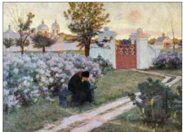
К.К. Костанді. Квітучий бузок. 1902. Колекція Одеського художнього музею

Живописна школа Одеси має глибинні традиції: стародавнє мистецтво Причорномор'я, пленеризм художників ТПРХ, виставки світового рівня