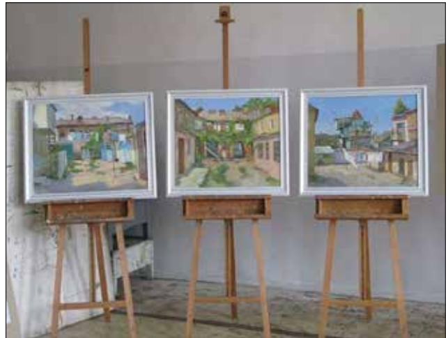
А. Шкляр. Одеські дворики. 2018. Науковий керівник П.І. Нагуляк

ристано стилістику чорно-білого кінематографу під акомпанемент роялю.